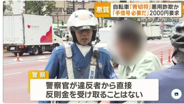
警察が注意呼びかけ

自転車で曲がる時などは手を使って合図する、いわゆる手信号が求められ、違反すると反則金5000円の対象になります。