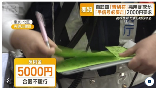
合図不履行は反則金5000円

しまかぜ法律事務所の井上昌哉弁護士は「10年以下の拘禁刑という詐欺罪の成立になる」と話します。